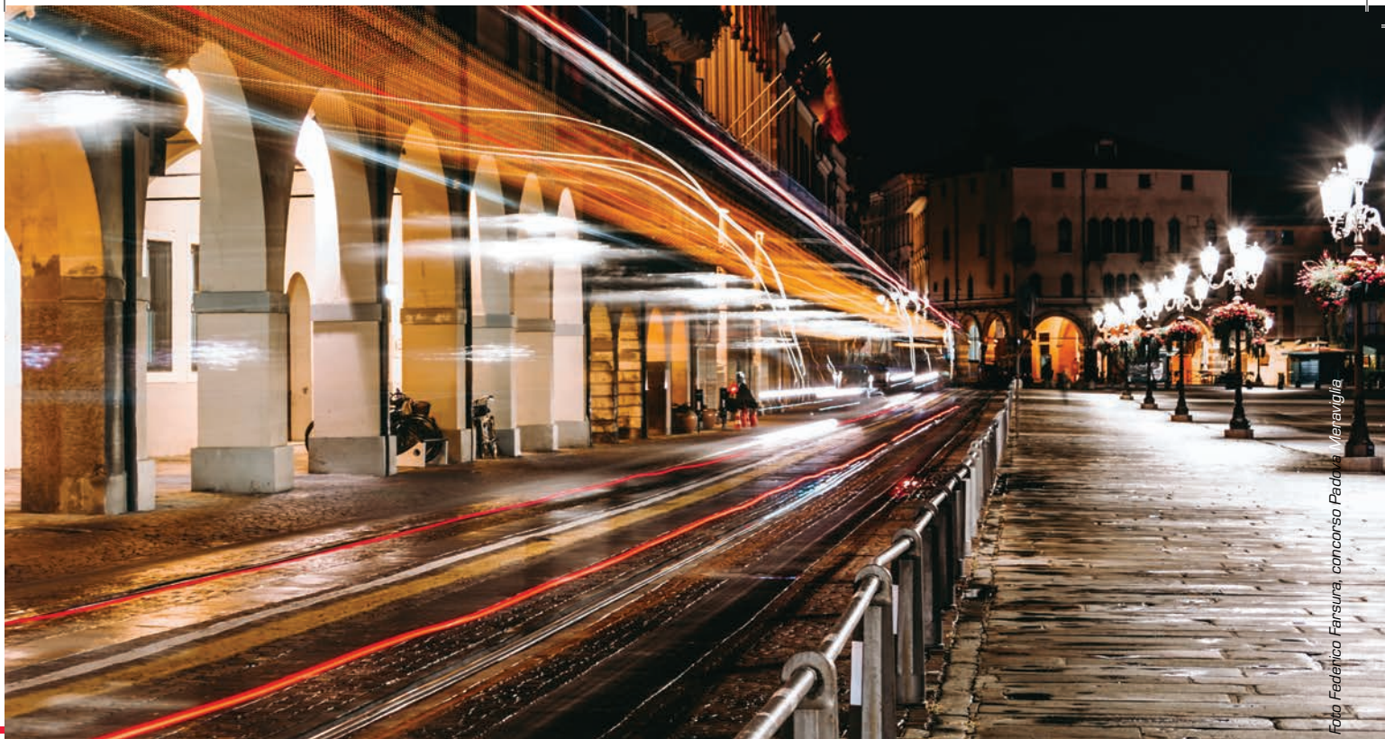
concorso Padova Meraviglia