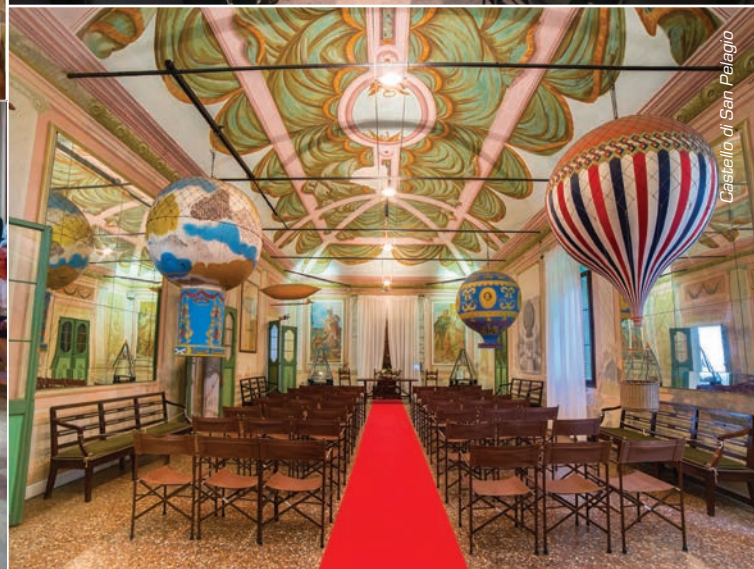
Castello di San Pelagio