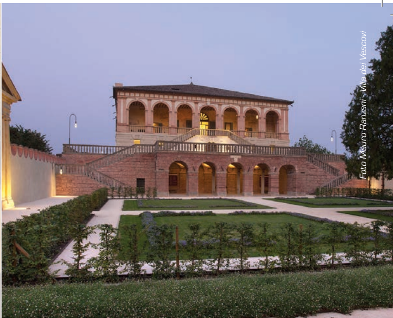
Villa dei Vescovi