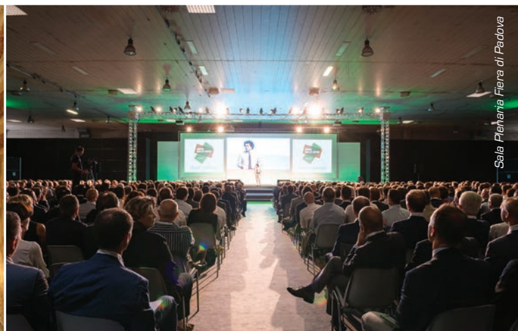
Sala Plenarie Fiera di Padova