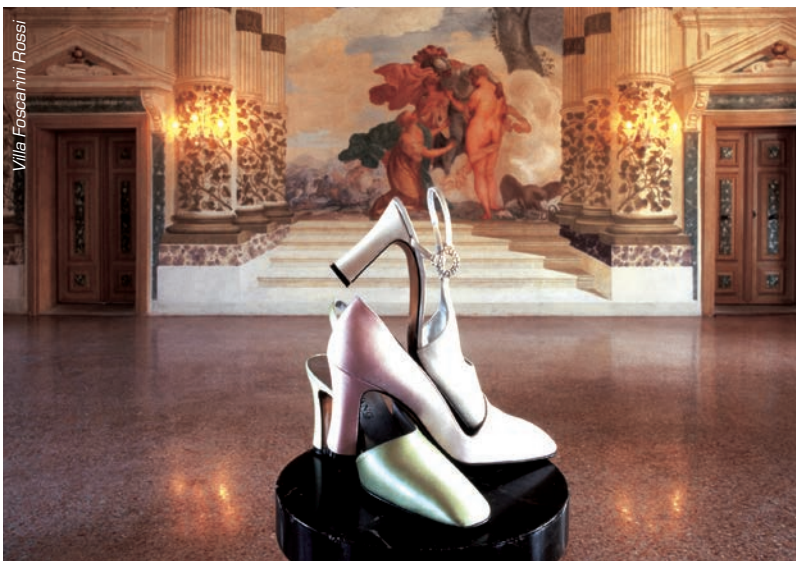
Villa Foscari Rossi