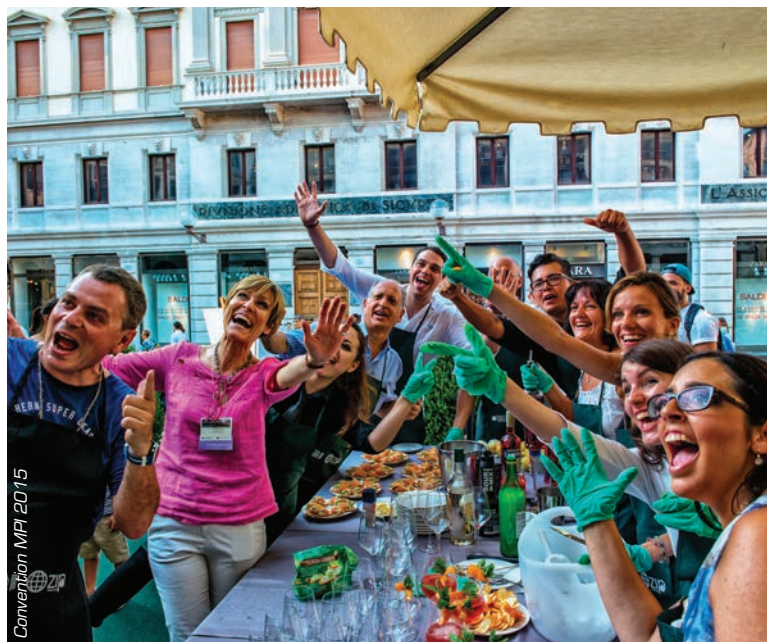
Convention MPI 2015

Padova offre ai suoi visitatori molte opzioni: Palazzo della Ragione, il "centro commerciale" più antico e bello d'Europa, eretto 800 anni fa, con i mercati delle Piazze, i negozi eleganti sotto i portici degli antichi palazzi; le visite esclusive, anche in orario serale, ai principali musei e monumenti; le escursioni sui Colli, con degustazioni enogastronomiche; la navigazione fluviale con soste nelle Ville Venete e nei castelli e le gite alla vicina Venezia.