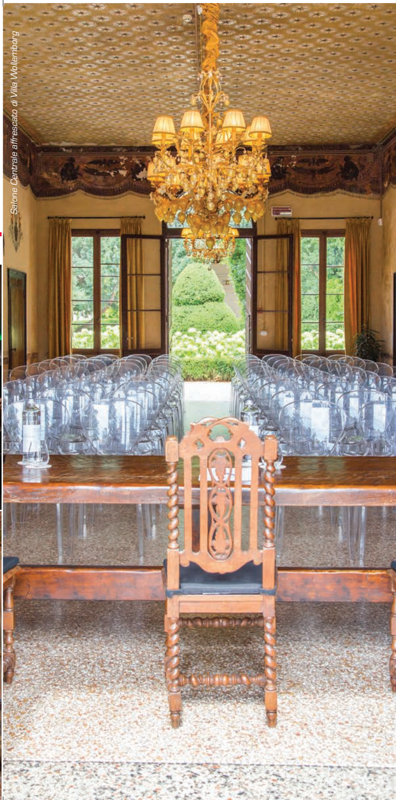
Salone Centrale affrescato di Villa Wollanborg