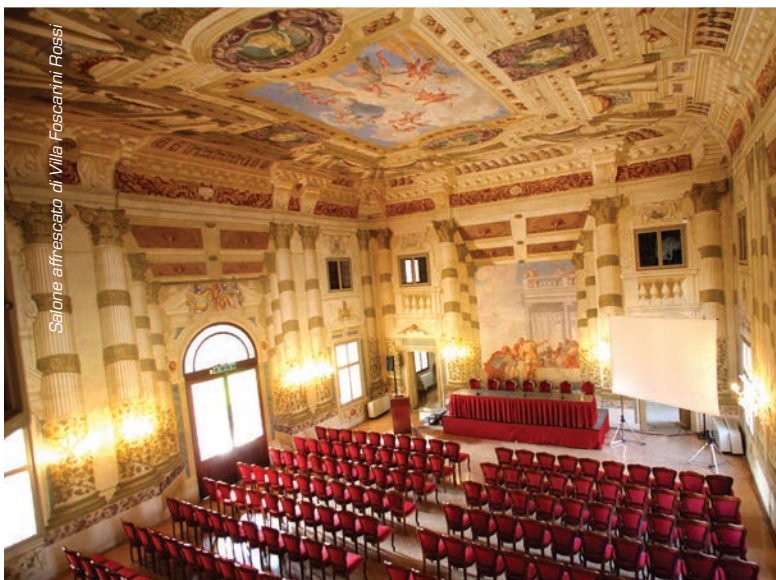
Salone affrescato di Villa Foscari Rossi

Padova, inoltre, dispone di hotel congressuali di ogni tipologia: grandi catene internazionali, boutique hotel nel centro storico, alberghi di antica tradizione familiare nell'area termale con un moderno orientamento al wellness.