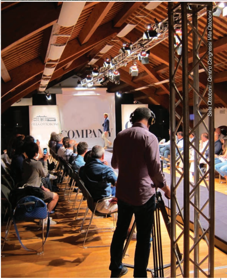
Sala Ottoboni - Centro Congressi Villa Ottoboni