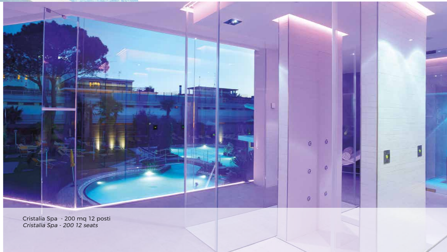
Cristalia Spa - 200 mq 12 posti Cristalia Spa - 200 12 seats