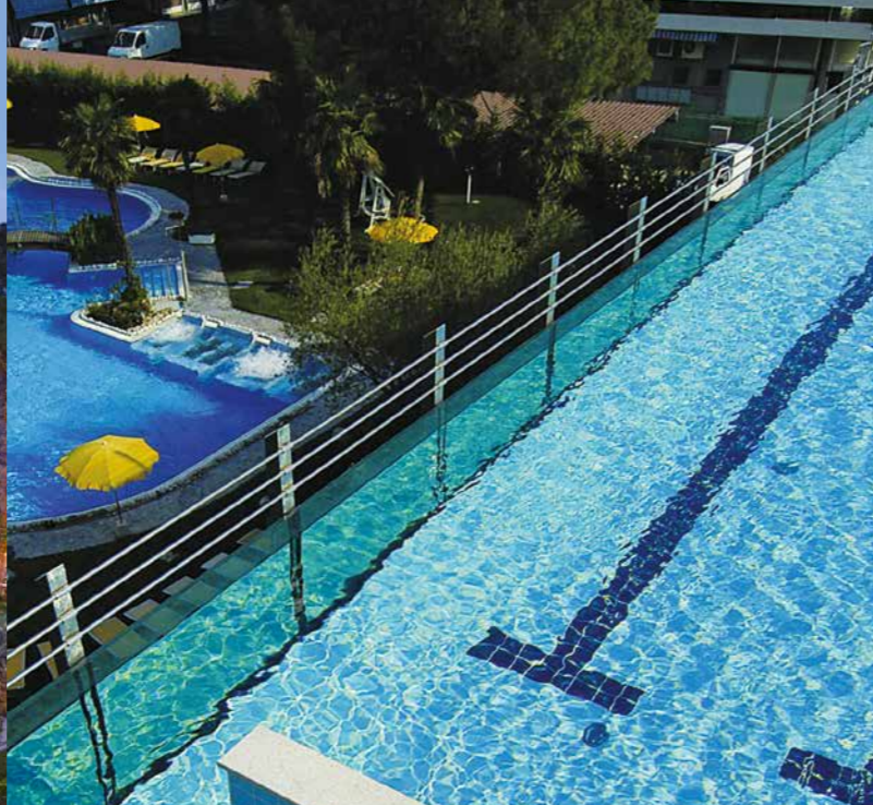
La piscina di vetro esterna - 150 mq 40 posti The external Glass swimmingpool - 150 mq 40 seats