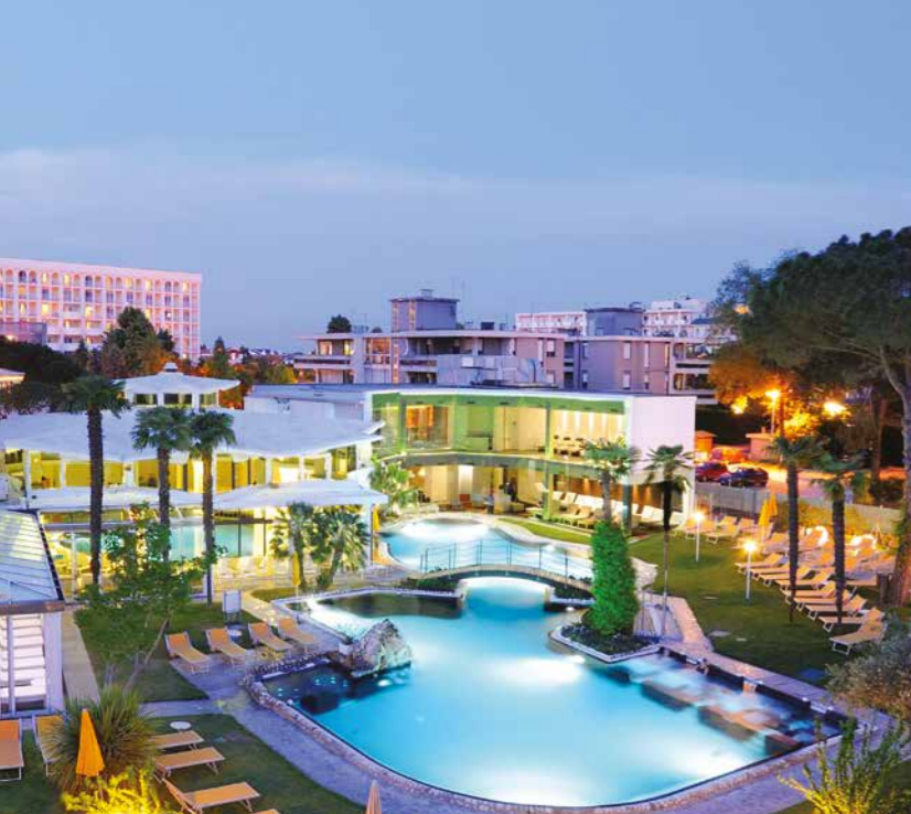
Parco Esterno - 2000 mq 600 posti Outside Park - 2000 mq 600 seats